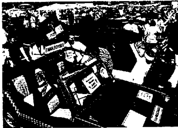
Nostalgieveranstaltung*: Unzufriedenheit ohne jedes Maß